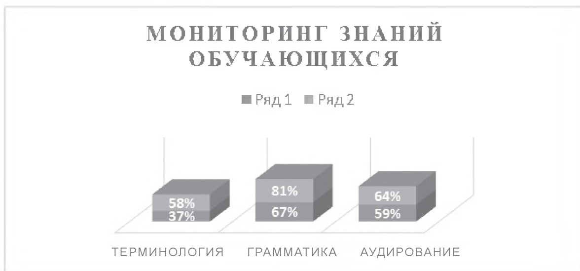
Диаграмма 1. Мониторинг знаний обучающихся в начале (ряд 1) и в конце (ряд 2) академического года

Данные тесты студентам предлагали выполнить в течение четырех академических часов. Результаты мониторинга корректности выполнения заданий представлены ниже, на диаграмме 1.