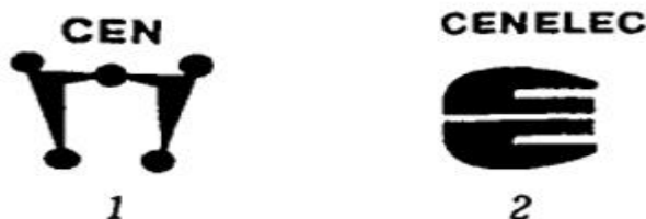
Рис. 4 - Транснациональные знаки соответствия стандартам: 1 - знак CEN; 2 - знак CENELEC

- комплексные знаки - предназначены для информирования о применяемых пищевых добавках.