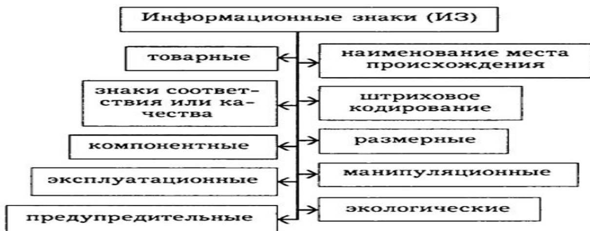
Рис.2 – Классификация информационных знаков

- знаки соответствия - знаки, подтверждающие соответствие маркированной им продукции установленным требованиям стандарта, других НД. Разрешение или лицензия на использование знака соответствия выдается органом по сертификации в установленном порядке. В зависимости от сферы применения различают национальные и транснациональные знаки соответствия.