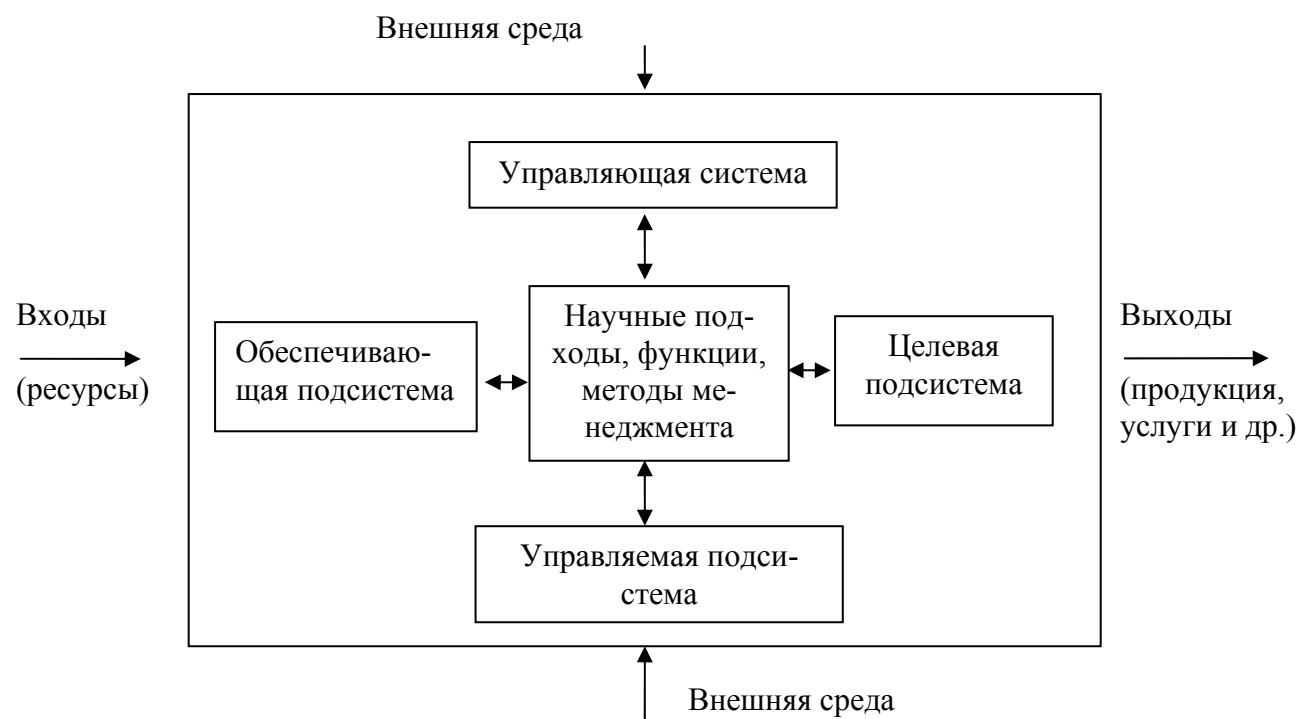
Рис. 1. Структура системы менеджмента

Структура системы менеджмента фирмы может быть отражена рисунком 2.1.