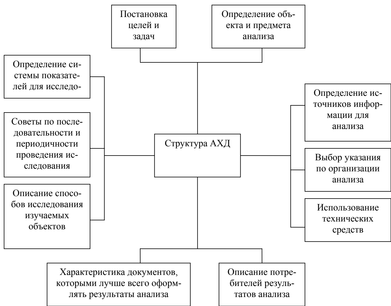
Рис. 3. Структура АХД организации

Постановка целей и задач АХД студентом должна быть осуществлена в соответствии со специализацией по обучаемой специальности в рамках заявленной темы исследования и избранного вида анализа. Так студенты финансовых специальностей должны в полном объеме провести финансово-экономический и технико-экономический анализ, в сокращённом виде управленческий, социально-экономический и экономико-статистический виды анализа, студенты специальности «Менеджмент организации» - в полном объёме управленческий, маркетинговый анализ, в сокращённом виде финансово-экономический и технико-экономический анализ.