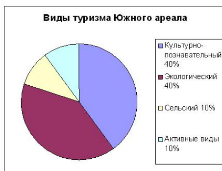
Рис. 4. Диаграмма по видам туризма Южного ареала Холмогорского района

выделить целый куст культурных ландшафтов в разных поселениях. Культурно-познавательный туризм здесь популярен за счёт посещения внешним потоком туристов Антониево-Сийского монастыря – центра паломнического туризма в Холмогорском районе. Кроме этого, Южный ареал необходимо организовать как центр экологического туризма и рекреации на исследуемой территории. В будущем обязательным должно быть создание новой особо охраняемой природной территории – природного парка Звозский. Совместно с Сийским заказником и последующим на их территории размещением туристкой и рекреационной инфраструктуры при грамотном симбиозе природной и антропогенной сред, Южный ареал может стать крупным центром экологического туризма и просвещения не только Холмогорского района, но и Архангельской области.