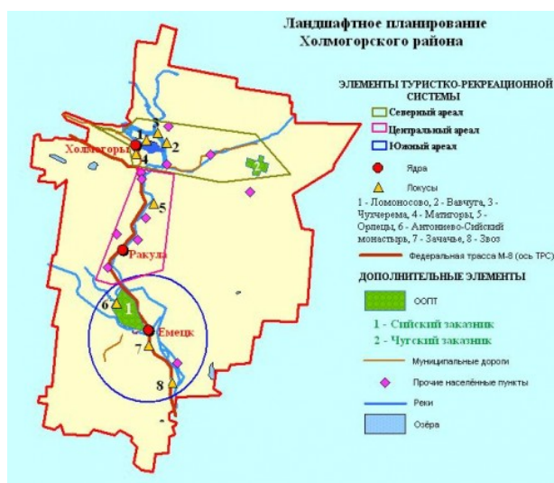
Рис. 1. Ландшафтное планирование Холмогорского района

В данной научной работе была составлена картосхема ландшафтного планирования Холмогорского района (Рис. 1), выполненная в геоинформационной системе в программе MapInfo , с нанесением основных элементов туристско-рекреационной системы по методике Е.Ю. Колбовского.