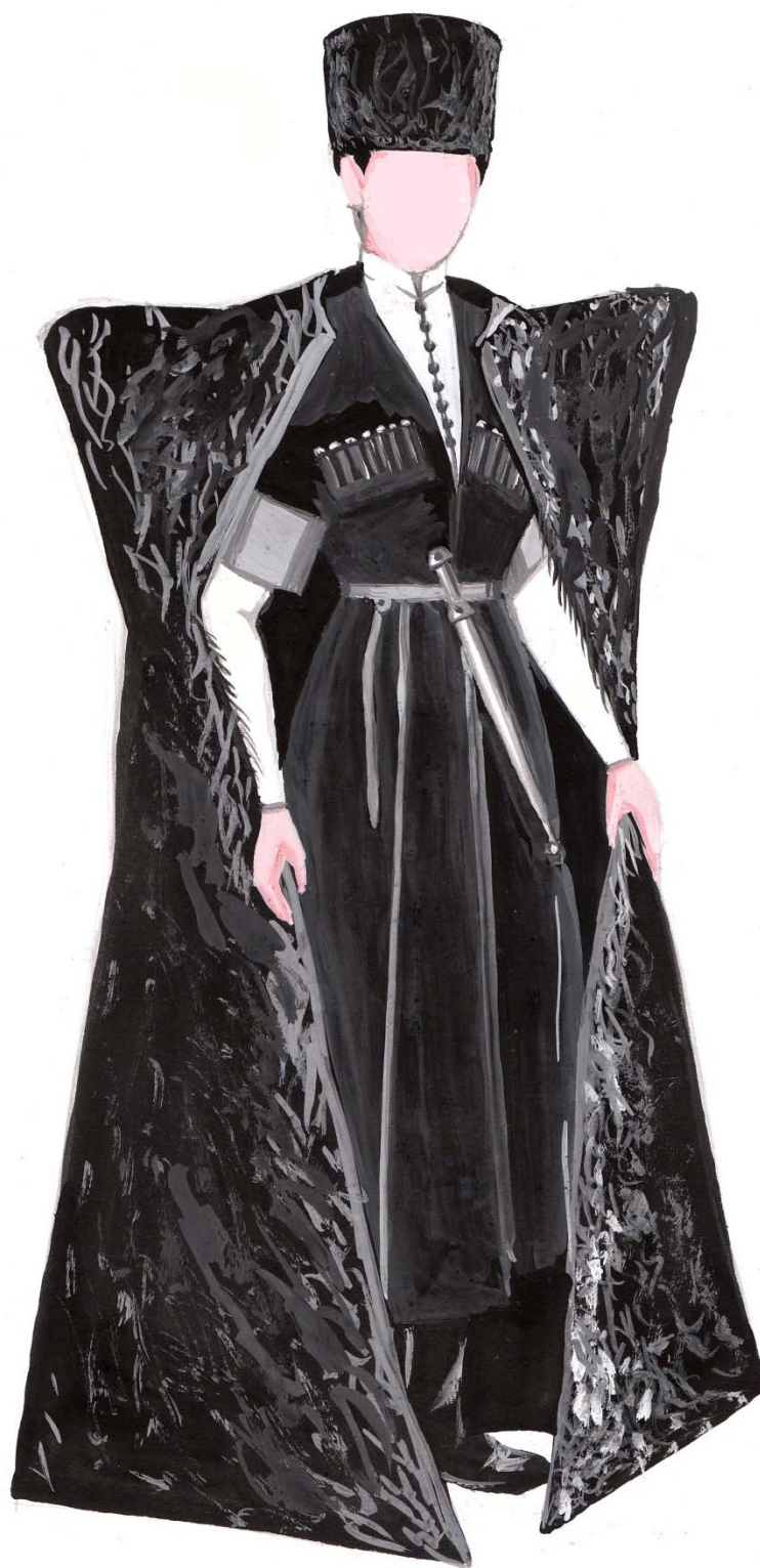
Рис. 1 Комплекс адыгской мужской одежды