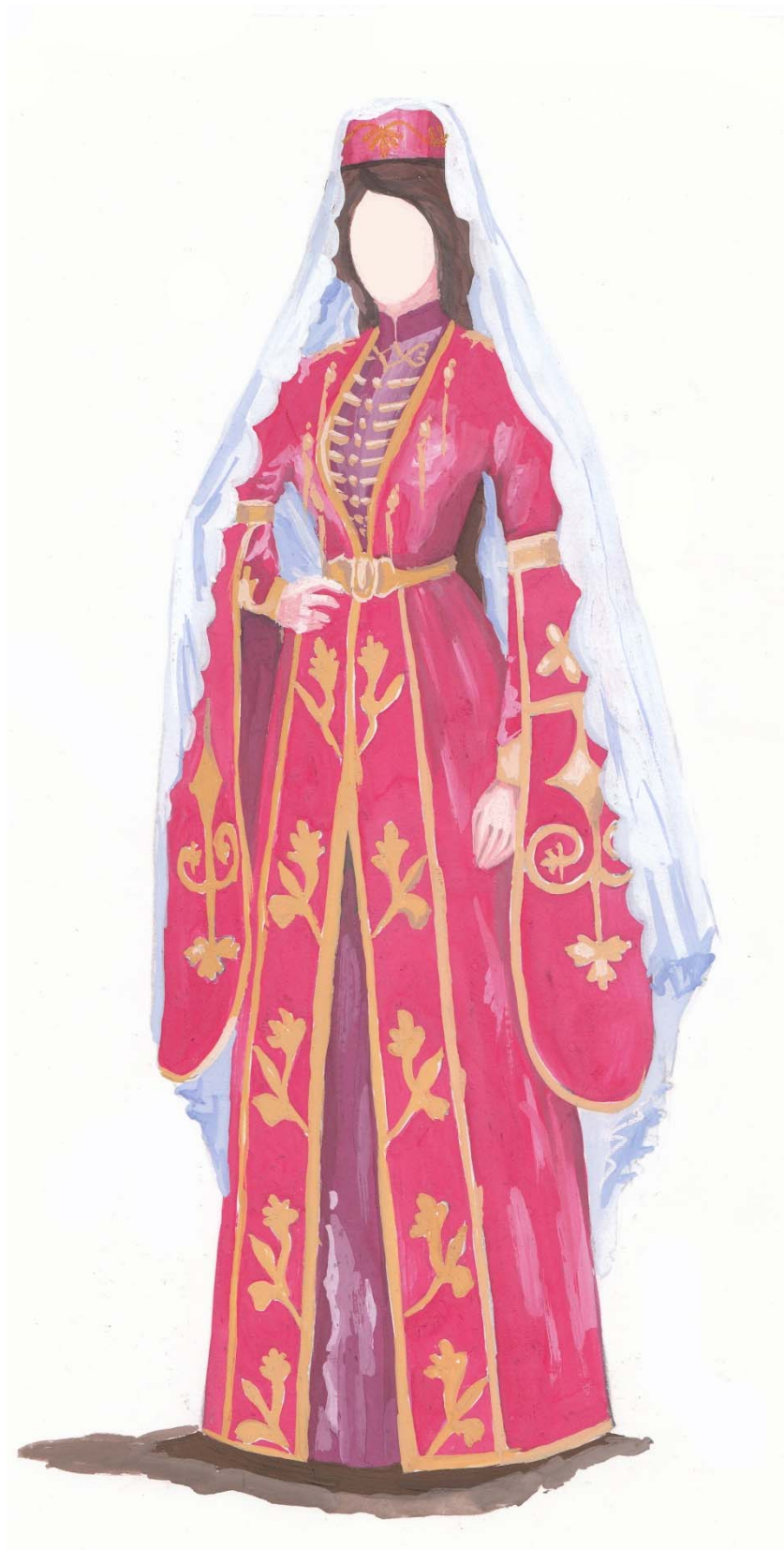
Рис. 3 Комплекс адыгской женской одежды