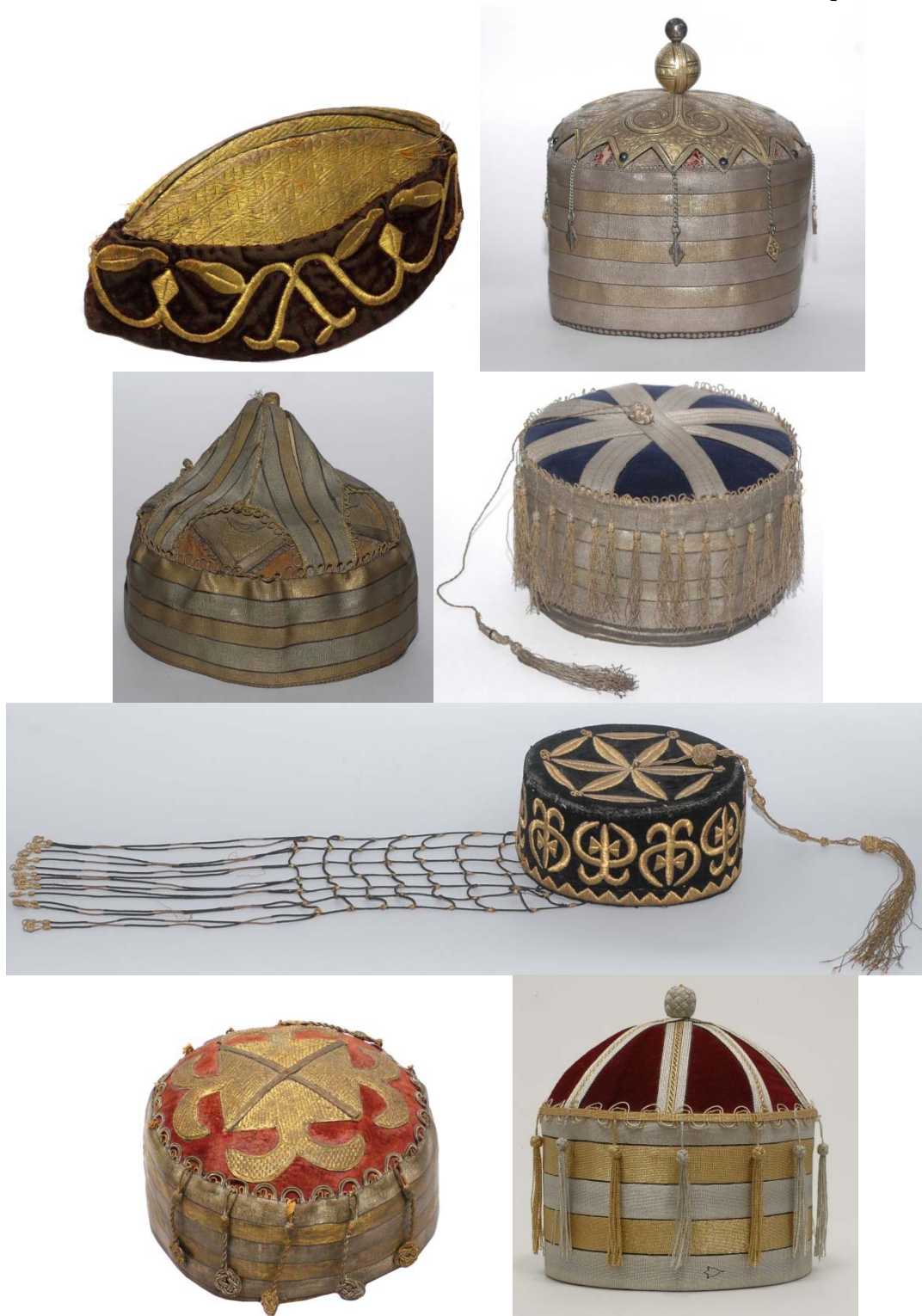
Рис. 6. Шапочки девичьи и молодых женщин галунные, шитьем вприкреп и вышивкой гладь конец XIX – начала XX вв.