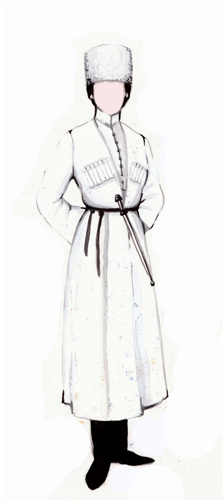
Рис. 2 Комплекс праздничной адыгской мужской одежды