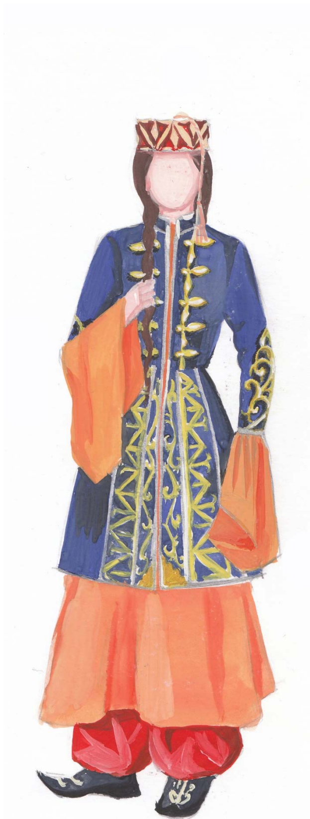
Рис. 4 Адыгский девичий кафтанчик