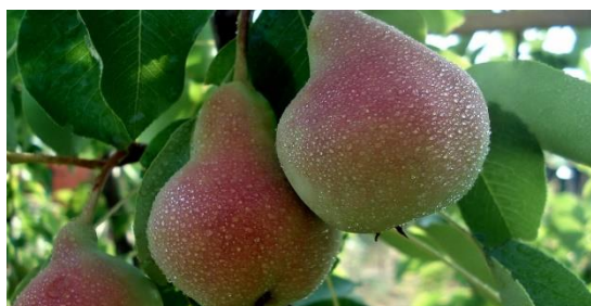
Рисунок 1 - Груша сорта «Лесная красавица»

Лучшими сортами для консервирования компотов являются такие сорта груш, как Бере Александр, Вильямс (рисунок 2), Кюре, Сен Жермен, Лесная Красавица (рисунок 1), Любимица Клаппа, Панна.