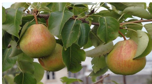
Рисунок 2 - Груша сорта «Вильямс»