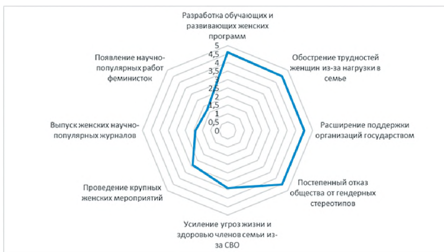
Рис. 2. Распределение мнений квалифицированных экспертов о степени влияния внешних факторов на развитие общественного объединения, средний балл при ранжировании

объединения женщин взяли на себя максимальную нагрузку по уходу за нуждающимися (как уже заразившимися, так и потенциальными пациентами) [6]. Сравнение результатов анкетирования и интервью продемонстрировали комплементарность данных. Получилось, что первые позиции остались теми же, они лишь на один-два пункта сдвинулись вниз или вверх по отношению друг к другу (рис. 2).