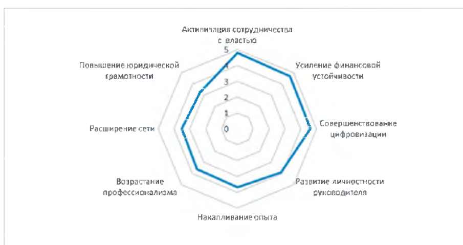
Рис. 4. Распределение мнений квалифицированных экспертов о степени влияния внутренних факторов на развитие общественного объединения, средний балл при ранжировании

опытных руководителях-лидерах, но и девушках [8, с. 41]. Анализ материалов интервью экспертов также подтвердил значимость этих внутренних факторов в качестве ключевых, которые способствуют развитию общественных объединений женщин в современной России (рис. 4).