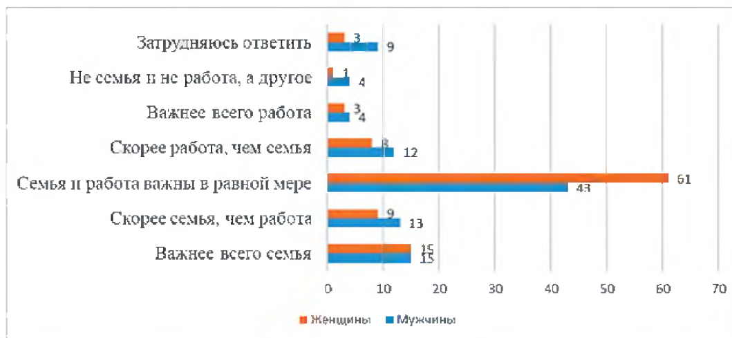
Рис. 6. Сравнение мнений опрошенных мужчин и женщин о приоритете для большинства современных россиянок семьи или профессиональной деятельности (2024), % опрошенных

стов однозначно связывают жизнь женщин в большей степени с семьей, чем с профессиональной деятельностью (рис. 6).