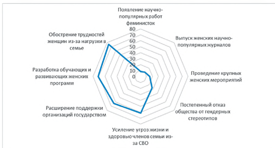
Рис. 1. Распределение мнений респондентов-женщин о степени влияния внешних факторов на развитие общественного объединения, % опрошенных