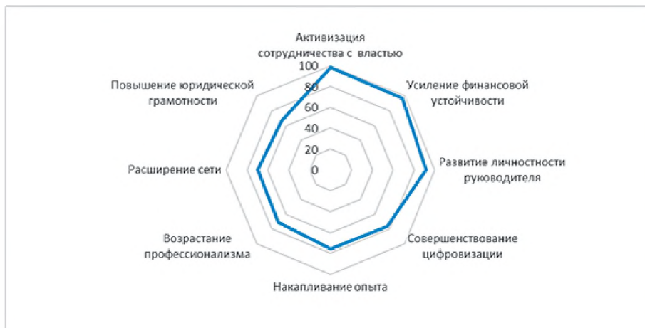
Рис. 3. Распределение мнений респондентов-женщин о степени влияния внутренних факторов на развитие общественного объединения, % опрошенных

зарождаются и действуют в рамках самих общественных объединений женщин (рис. 3).