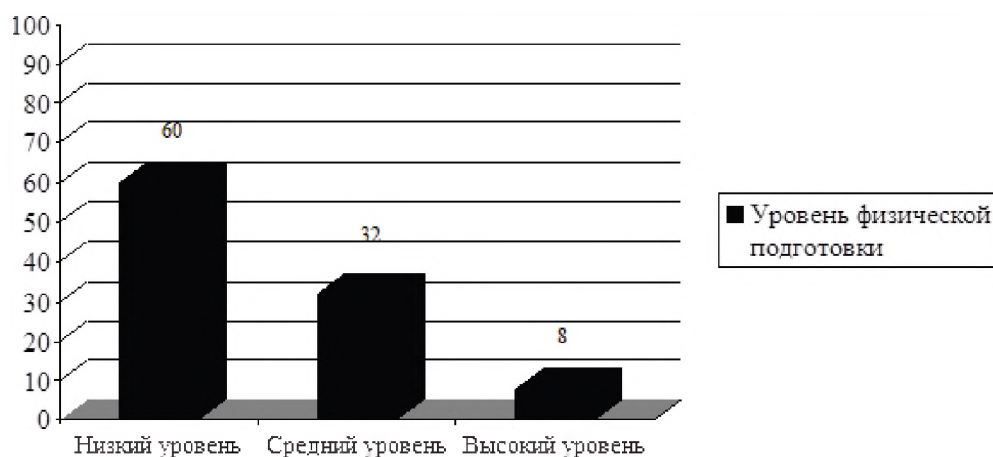
Рис. 6 Показатель физической подготовки молодых людей младших курсов образовательных организаций высшего образования, чел., %