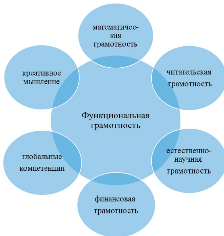
Рис. 1. Основные компоненты функциональной грамотности (по данным OECD) (составлено по источнику 9)

дефиниция «социальная грамотность» не изучена в полной мере, несмотря на то, что данной проблеме посвящено достаточное количество работ, касающихся как педагогической теории, так и педагогической практики.