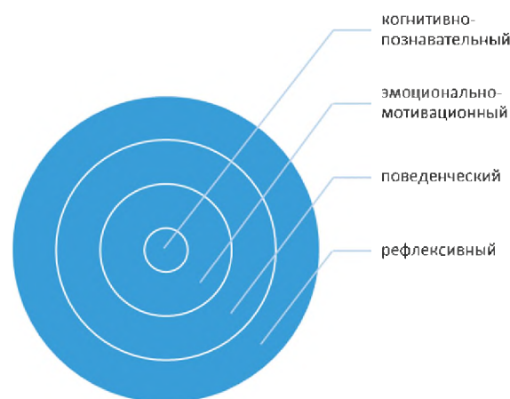
Рис. 3. Структура социальной грамотности по А.Ю. Борщевской и С.И. Карповой [2, с. 100]

А.Ю. Борщевская и С.И. Карпова в статье «Формирование социальной грамотности младших школьников во внеурочной деятельности» (2022) социальную грамотность рассматривают сквозь призму четырех ее компонентов: когнитивно-познавательного, эмоционально-мотивационного, поведенческого и рефлексивного (рисунок 3) [2].