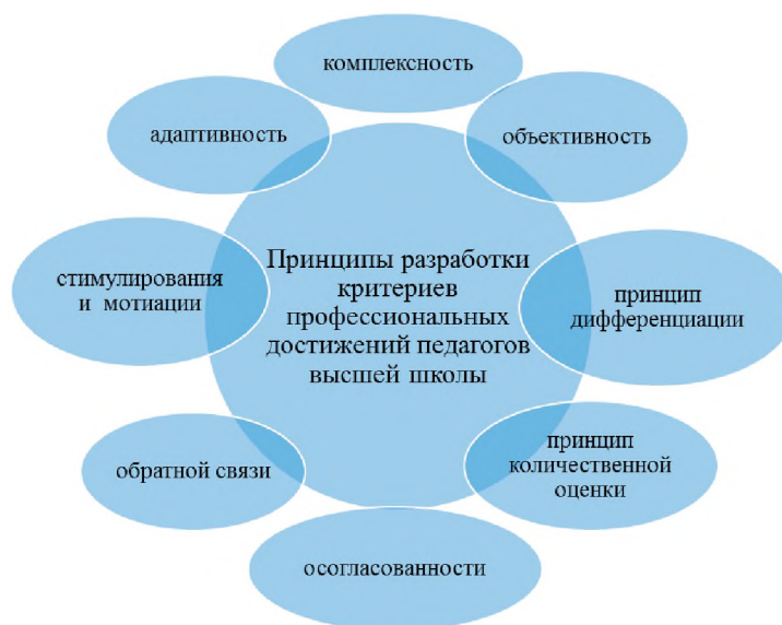
Рис. 3. Принципы разработки критериев профессиональных достижений педагогических работников

чин. Изучение различных подходов к разработке критериев и показателей эффективного контракта для научно-педагогических работников в ряде университетов нашей страны позволило нам обозначить следующие принципы разработки критериев профессиональных достижений педагогических работников (рисунок 3).