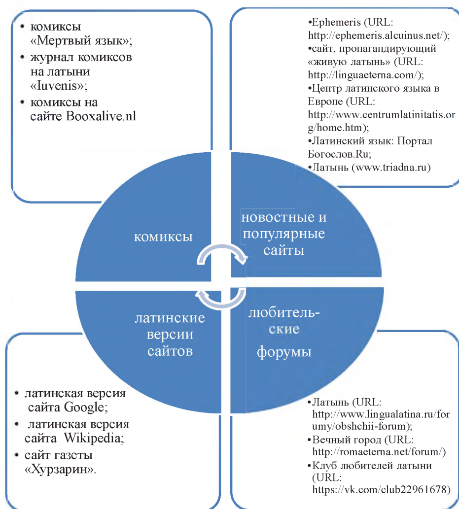
Рис. 2. Информационные ресурсы в сети интернет для самостоятельного изучения латинского языка [7]

материалы. Представим краткий обзор сведений о цифровых библиотеках и порталах с самой большой базой источников латинских и греческих материалов: