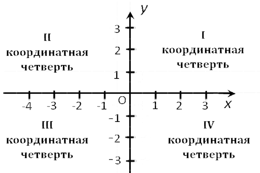
График 1. Декартова система координат

На представленном графике ось абсцисс (OX) охватывает такие значимые элементы, как система отношений отдельного индивида с окружающим миром, а также совокупный внешний опытный набор, который человек приобретает в деятельности вне себя [20, с. 130]. На оси ординат (OY) расположен человеческий внутренний мир, и все происходящее у него внутри [1, с. 27]. Все, что находится ниже оси абсцисс (область III и IV координатных четвертей) – это совокупность вопросов персонального характера, возникающих у любого человека и связанных со следующими важными для него темами: его прошлым, забытым, мотивирующим [2, с. 41]. Выше оси абсцисс (область I и II координатных четвертей) аккумулирует личностный опыт, представляющий высшее Я, стремление к обретению целостности [3, с. 18].