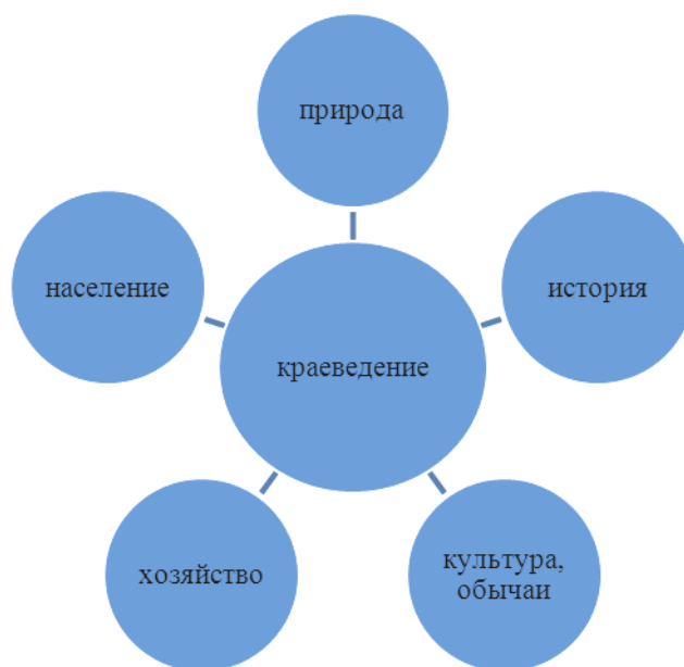
Схема 1. Структура краеведения

Каждая из сторон краеведения может быть представлена с помощью математических задач: арифметических, геометрических, статистических, комбинаторных и др. в рамках программы для начальной школы и в соответствии с требованиями ФГОС НОО нового поколения. Математика позволяет осуществлять целенаправленную социализацию на разных уровнях: когнитивном, аксиологическом, оценочном, деятельностном, социально-психологическом и т.д.