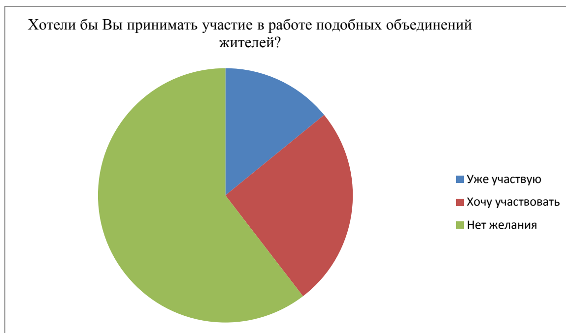
Рисунок 2 - Готовность к участию населения в ТОС

Как видно из диаграммы, подавляющее большинство жителей Республики (60%) не хотят участвовать в каких-либо формах территориального общественного самоуправления. При этом необходимо отметить, вопреки существующему мнению, что в России наиболее социально активными являются люди пенсионного возраста, данные исследования показали, что большую готовность к участию в местном самоуправлении проявляют люди среднего возраста (31-54 года), как правило работающие и имеющие высшее образование.