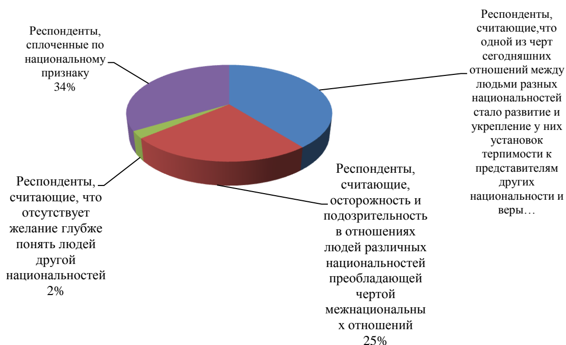
Диаграмма 3. Потенциальные и реальные источники напряженности в сфере межнациональных отношений в Адыгее

Результаты исследования показывают, что 65,3% респондентов оценивают межнациональные отношения в Республике Адыгея как стабильные; 28,4% опрошенных респондентов выражают некоторую озабоченность состоянием межэтнических отношений в республике, но не считают эту тенденцию опасной; 6,3% респондентов высказывают тревогу, что межнациональные отношения в республике могут перейти в острую форму конфликта.