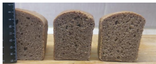
Рис. 2. Хлеб с добавлением опар из льняной муки (слева направо К, В3, В4)