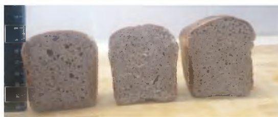
Рис. 1. Хлеб с добавлением льняной муки (слева направо: К, В1, В2)