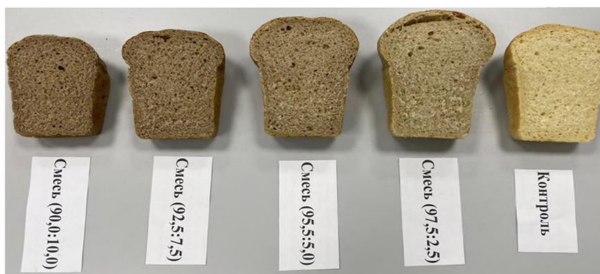
Рис. 1. Образцы хлеба из композитных смесей