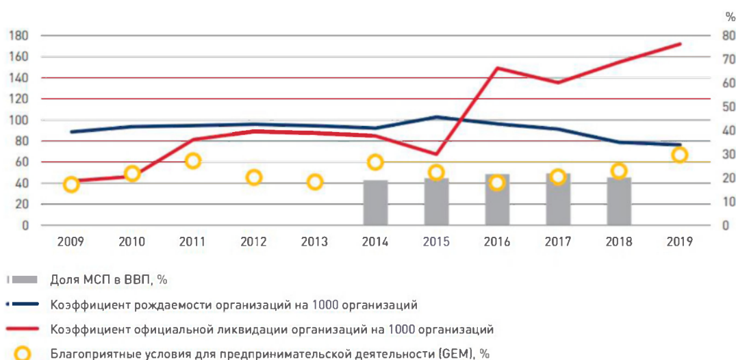
Рис. 1. Показатели развития сектора МСП и оценка населением благоприятных условий для предпринимательской деятельности, 2009–2019 гг. [2]