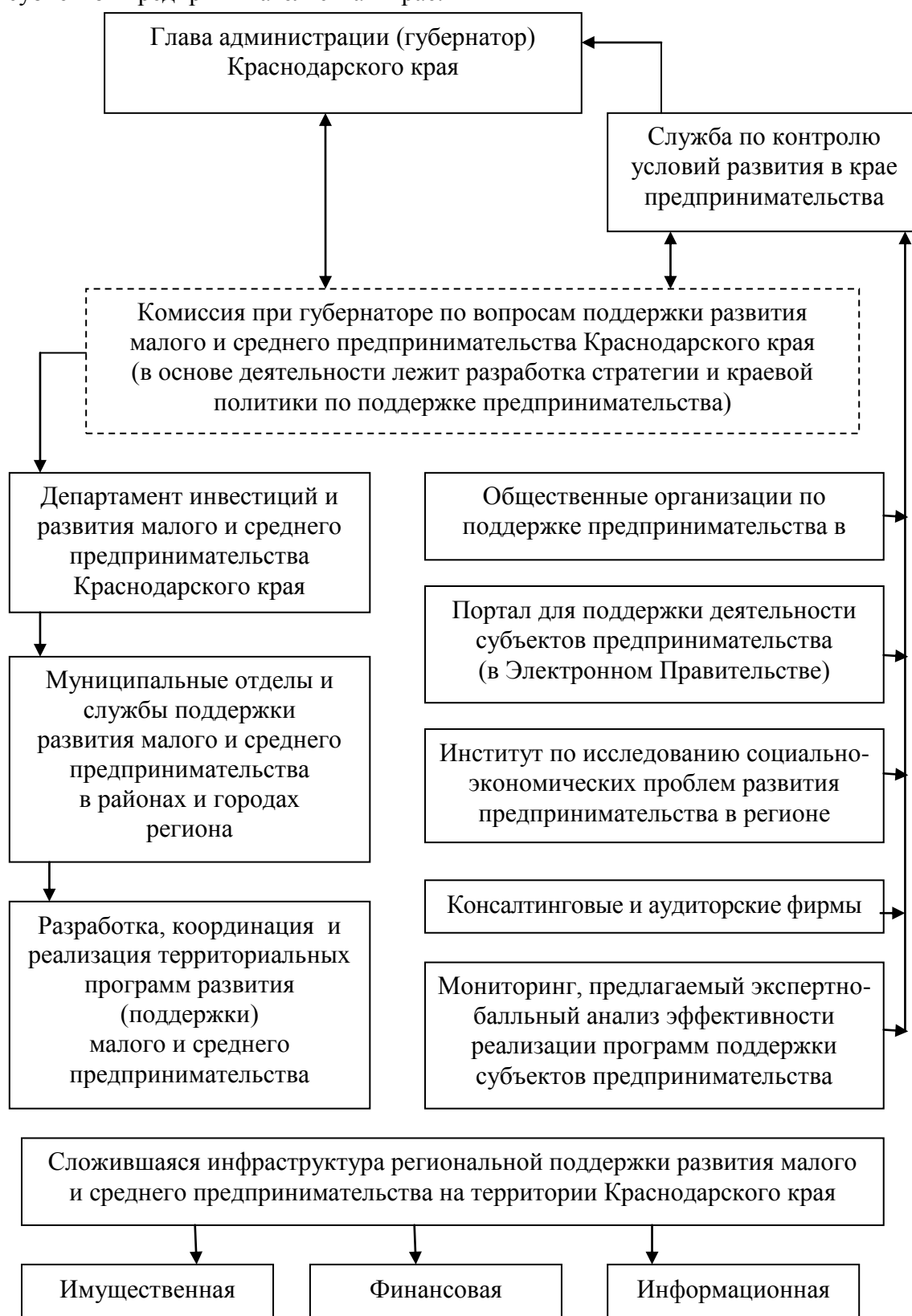
Рис. 1. Рекомендуемая к внедрению модель системы региональной поддержки субъектов предпринимательства на территории края

Представленная модель позиционирует целесообразность внедрения рекомендации о консолидации, как организационной, так и институциональной региональной поддержки субъектов предпринимательства в крае.