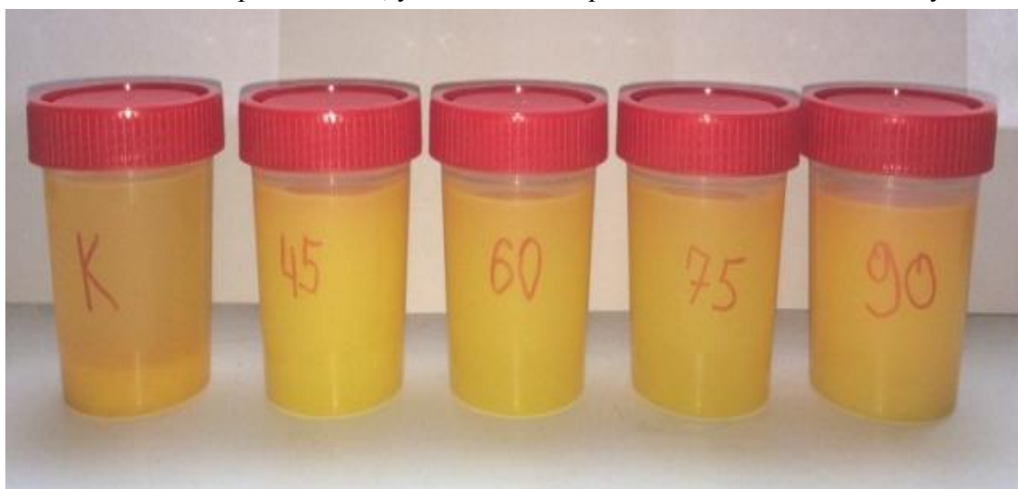
Рис. 2. Внешний вид образцов свежевыжатого апельсинового сока, обработанного ультразвуком различной интенсивности, и контрольный образец

Изображенный ниже рисунок демонстрирует примеры визуального определения степени соответствия требованиям, указанным в нормативно-технических документах.