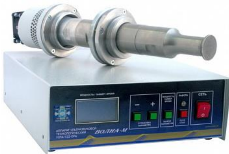
Рис. 1. Ультразвуковой аппарат серии «ВОЛНА-М»

Определение органолептических свойств восстановленного сока проводится соответствующему межгосударственному стандарту №8756.1-79 «Продукты пищевые консервированные. Методы определения органолептических показателей, массы нетто или объема и массовой доли составных частей». [5]