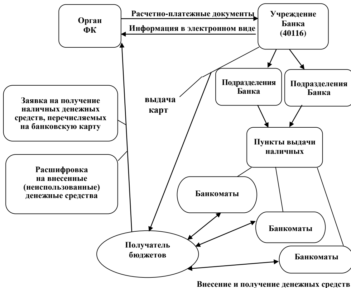
Рисунок 1. Взаимодействие участников бюджетного процесса при использовании банковских карт Федерального казначейства 1

календарных дней со дня перечисления, бюджетополучатель представляет «Расшифровку сумм неиспользованных средств». Внесение наличных денежных средств осуществляется уполномоченными работниками Клиента с использованием карты через банкомат или пункт выдачи наличных денежных средств банка, выдавшего карты. На рисунке 2 отражена схема внесения клиентом территориального органа Федерального казначейства наличных средств на банковскую карту.