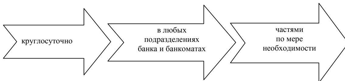
Рисунок 3. Основные преимущества использования карт

Практическое воплощение данного направления в ряде территорий, например, таких как Краснодарский край, Саратовская, Тюменская области дало следующие положительные преимущества участникам и неучастникам бюджетного процесса получать и вносить наличные денежные средства: