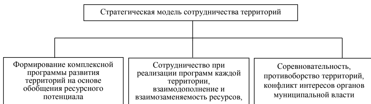
Рис. 1. Формы стратегического взаимодействия территорий в рамках стратегической модели сотрудничества

В современных экономических условиях в активной политической среде муниципалитеты должны достигать цели устойчивого экономического роста с максимальными затратами при ограниченных ресурсах: P(G) \rightarrow \max . Для достижения целей устойчивого роста в рамках реализации положений программ социально-экономического развития регионов представляется оптимальным переход от формирования и реализации отдельных программ к их системному синтезу.