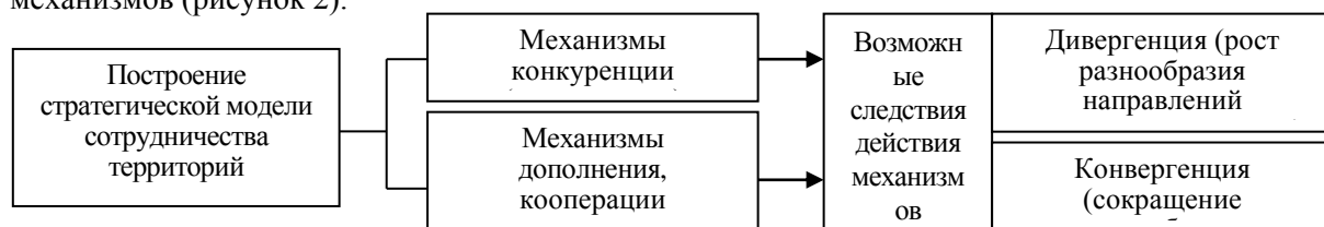
Рис. 2. Механизмы построения стратегической модели сотрудничества территорий

Построение модели сотрудничества территорий в целях реализации программ социально-экономического развития регионов должно строиться на основах использования следующих механизмов (рисунок 2).