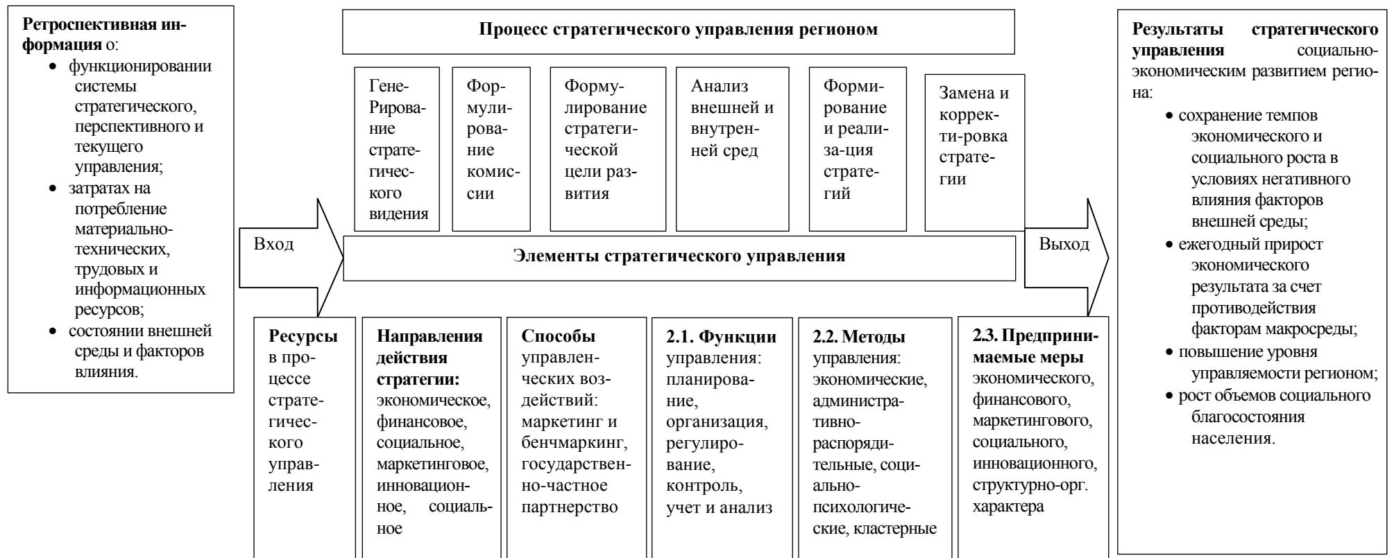
Рис. 1. Схема стратегического управления социально-экономическим развитием региона (составлено авторами)

Влияние факторов внешней среды на систему управления текущей деятельностью и перспективным развитием региона