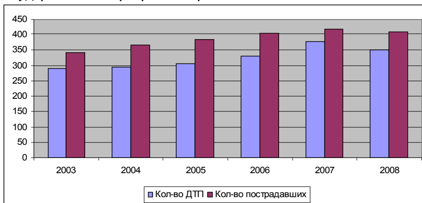
Рис.3. Динамика ДТП по Республике Адыгея за период с 2003-2008 гг.

В целях снижения ДТП и устранения причин гибели людей в РА успешно реализована «Программа повышения безопасности дорожного движения на период 2006-2008 годы». Она включала в себя мероприятия по совершенствованию организации дорожного движения, приведению обстановки пути в соответствие со стандартами. В новых условиях задача обеспечения безопасности дорожного движения в РФ и, в частности, в РА непосредственно связана с результатами социально-экономических преобразований, развитием гражданского общества и не может быть решена без совместных усилий государства и общества, без общественной поддержки и участия широких слоев населения в реализации государственных программ и проектов.